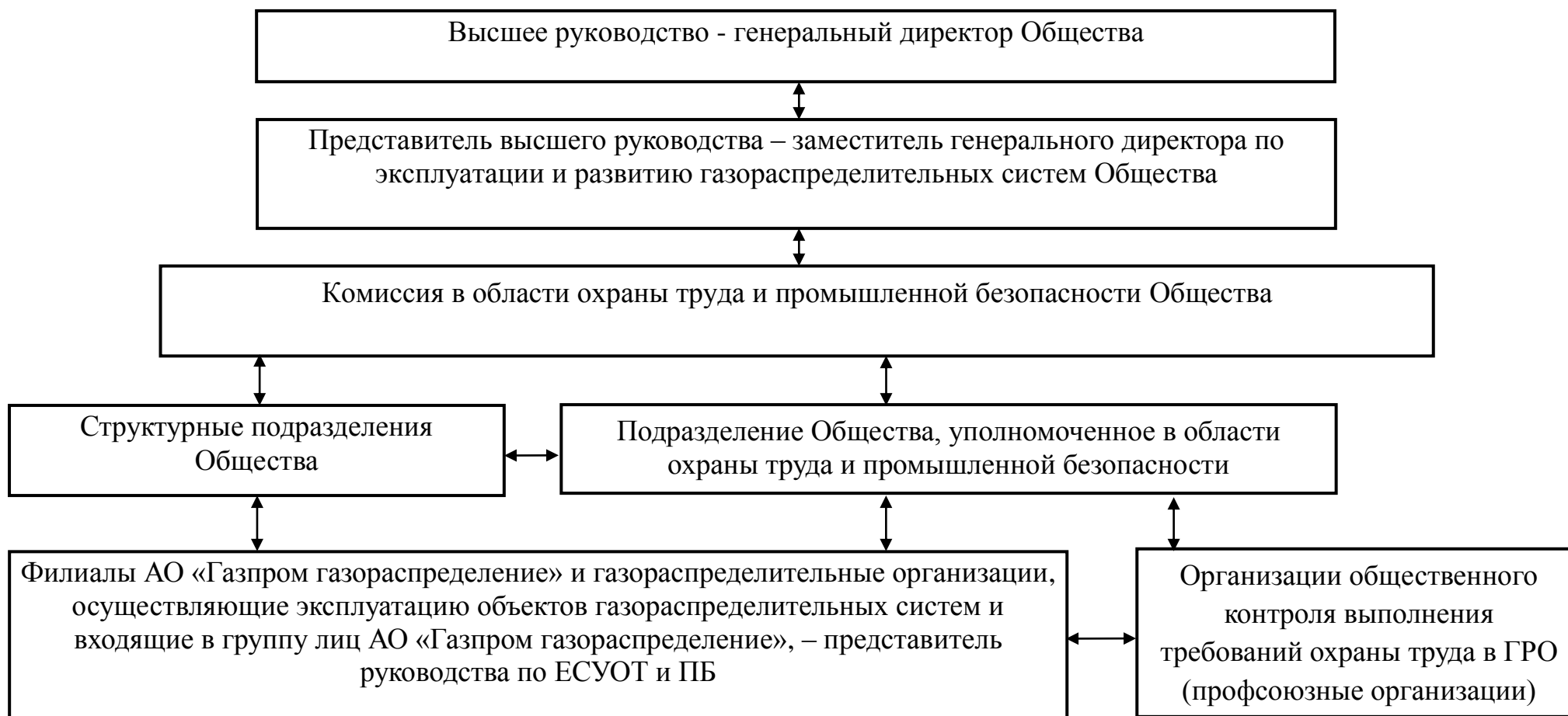
Схема структуры Единой системы управления охраной труда и промышленной безопасностью в АО «Газпром газораспределение»